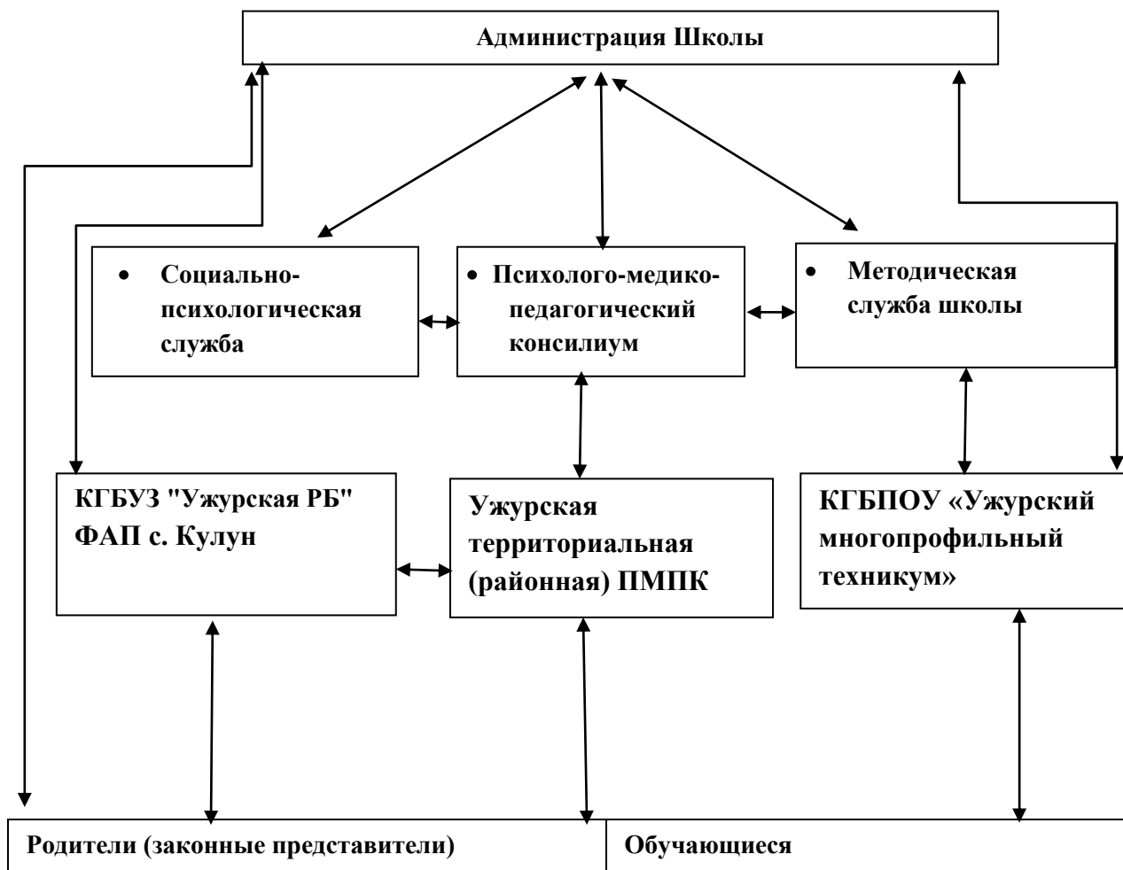
Схема межведомственного взаимодействия

профессиям: штукатур, повар, слесарь, сварщик. Подобные формы организации помогают ребятам приобрести определенные практические умения, необходимые в конкретной сфере профессиональной деятельности, выбрать профессии.